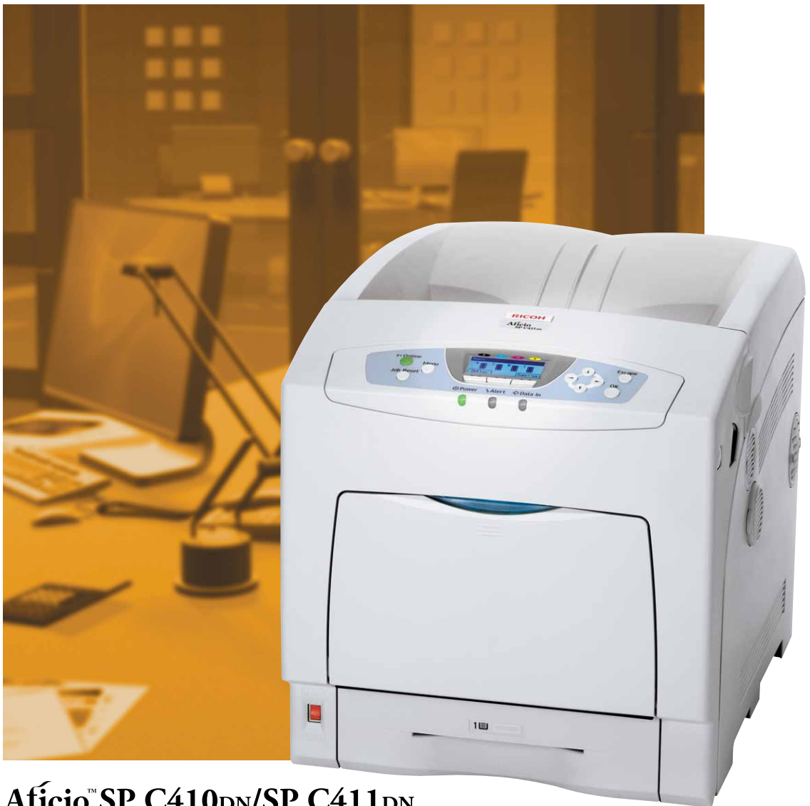
Aficio™ SP C410DN/SP C411DN