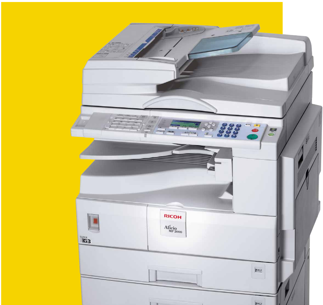
Aficio™ MP 1600/MP 2000